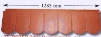
ZF ZIERER-Biber-Dach-Element, rot